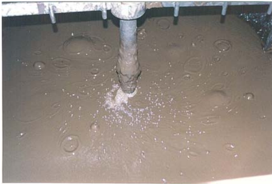
Fermentation naturelle à haute température