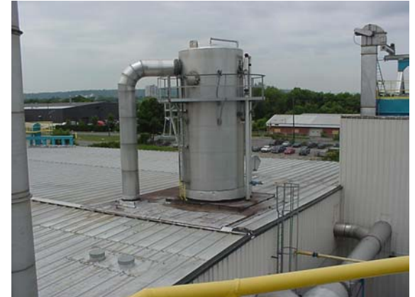
Evaporateur : partie externe