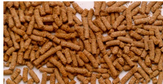
Le produit final : un engrais