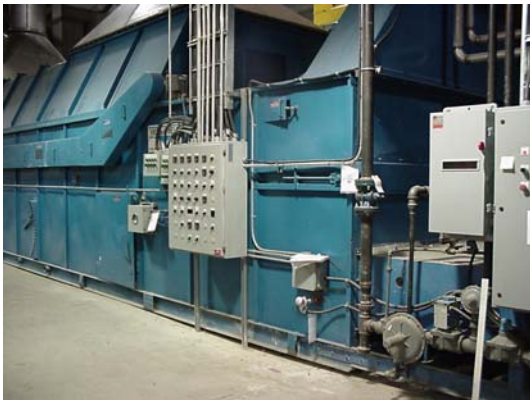
Unité de séchage