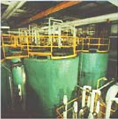
Unités de fermentation