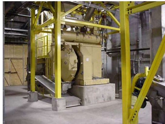
Fabrication des Granulés