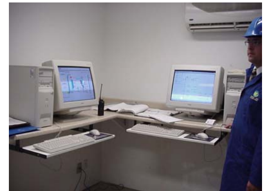
Unité de commande informatisée